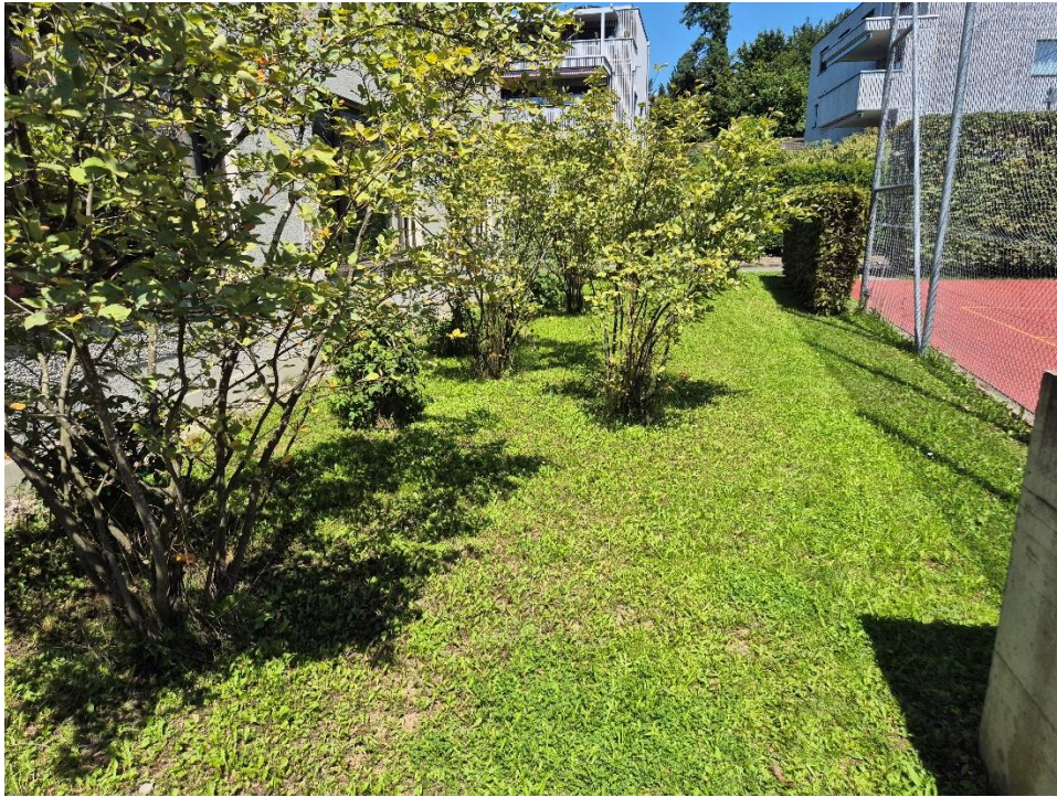
Standort neuer Sandkasten zwischen Mettlen F und Allwetterplatz

Die angrenzende Umgebungsgestaltung ist dabei so vorzunehmen, dass für den technischen Dienst eine pflegeleichte Ausführung gewährleistet ist. Die bestehenden Rabatten vor dem Gebäude Mettlen F sind auszugraben und mit niedrig wachsenden Bodendeckern neu zu bepflanzen. Dadurch kann der momentane intensive Pflegeaufwand der Rabatten erheblich reduziert werden. Die Platzentwässerung des Allwetterplatzes soll an die Meteorwasserleitung westlich des Schulhauses C angeschlossen werden und dadurch die momentan verwendete Meteorwasserleitung entlasten, bei welcher die Kapazitätsgrenze erreicht ist.