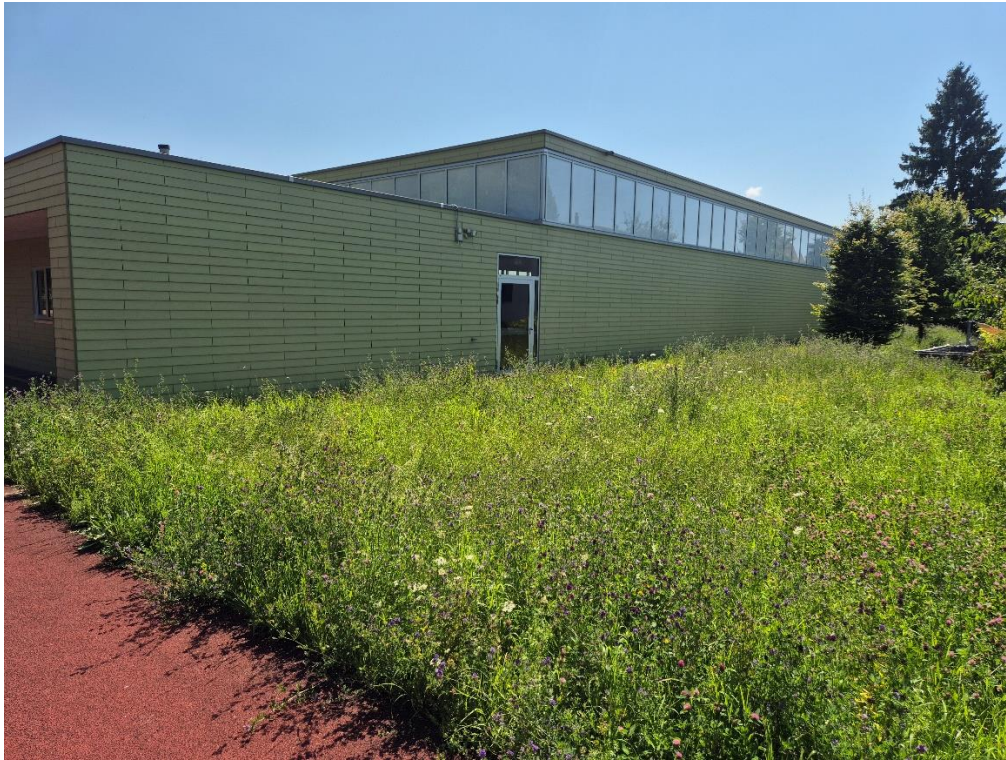
Neuer Standort der Weitsprunganlage entlang der Westfassade der Sporthalle Mettlen H

Dadurch wird können zukünftige Abnutzungserscheinungen des Belages infolge des Sandes verhindert werden, was die Lebenserwartung deutlich verlängert. Die nicht mehr zweckmässigen Reckstangen werden demontiert. Der neu vorgesehene Allwetterbelag wird östlich des bestehenden Platzes erweitert und mit altersgerechten Spielgeräten, welche auch Reckstangen umfassen, sowie geeigneten Sitzgelegenheiten ergänzt. Zum Schutz angrenzender Gebäudeteile wird der bestehende Ballfang in Richtung Gebäude Mettlen F verbreitert. Aus Sicherheitsgründen soll zwischen den neuen Spielgeräten und dem Allwetterplatz ein weiterer Ballfang realisiert werden. Seitens der Leitung der Tagesstrukturen besteht der ausdrückliche Wunsch nach der Einrichtung eines ausreichend gross dimensionierten Sandkastens im Bereich des Gebäudes Mettlen F.