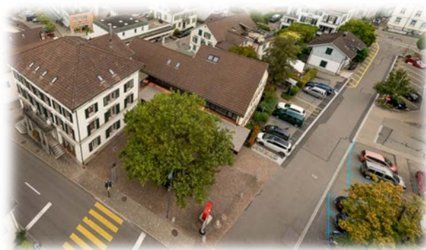
Gemeindehaus Pfäffikon ZH

Gemeinderatskanzlei Telefon 044 952 51 80